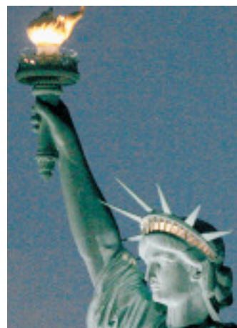
Willkommen: Auf Augenhöhe wird die Freiheitsstatue den Mühlenflieger begrüßen.